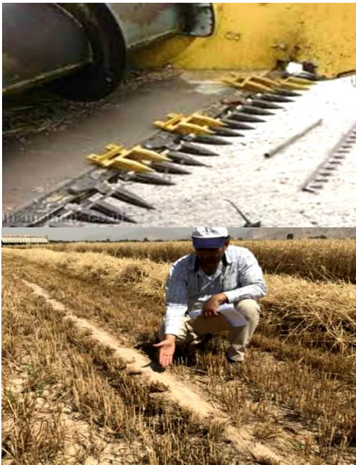
شکل ۶- آسیب به ماشین‌آلات برداشت محصول در روش کشت مرسوم گندم

مقداری خاک نیز همراه با محصول وارد مخزن کمباین می‌شود. در حالی که در کشت گندم روی پشته‌های بلند به علت کشت همه بوت‌ها روی پشته‌ها و حذف مرزهای آبیاری، برداشت محصول با ارتفاع بسیار کم و بدون برخورد تیغه‌های کمباین با خاک ممکن بوده و به‌طور خودکار یک روش دوست‌دار کمباین است (شکل ۶). کشت روی پشته‌های بلند به‌صورت موقت و دائمی انجام می‌شود: