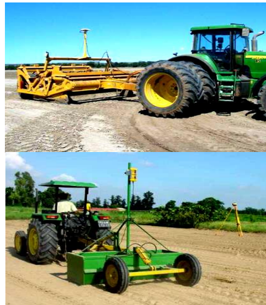
شکل ۵- تسطیح زمین توسط مسطح‌کننده لیزری Figure 5- Ground leveling by laser leveler

برای اجرای روش‌های نوین کشت بایستی زمین از تسطیح مناسبی برخوردار باشد؛ زیرا برای آبیاری یکنواخت مزرعه، بایستی زمین هموار بوده و دارای شیب یکنواخت و معینی باشد. اگر شیب کلی زمین مناسب بوده اما زمین کمی ناهموار باشد، انجام یک یا دو بار ماله (لولر) معمولی برای تسطیح زمین کفایت می‌کند. در صورت مناسب نبودن شیب کلی زمین و وجود ناهمواری زیاد در مزرعه، برای برخورداری کامل از مزایای کشت گندم روی پشته‌های بلند، لازم است زمین با ماله لیزری تسطیح اساسی شود و این کار هر پنج سال یک‌بار تکرار می‌شود (شکل ۵).