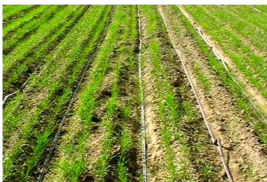
شکل ۳- استفاده از سیستم کشت روی پشته‌های بلند (به همراه