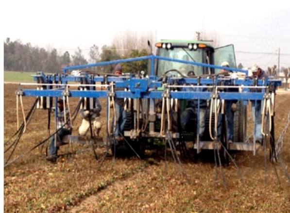
شکل ۴- تصاویری از دستگاه جمع‌آوری کننده نوارهای تیپ از مزرعه Figure 4- Pictures of the tape strips collecting device from the farm

با توجه به اعمال مقدار و دور آبیاری مشخص توسط کشاورزان، ظرفیت بالایی در بهبود و بازده آبیاری دارد (Shirinzhadeh et al., 2017).