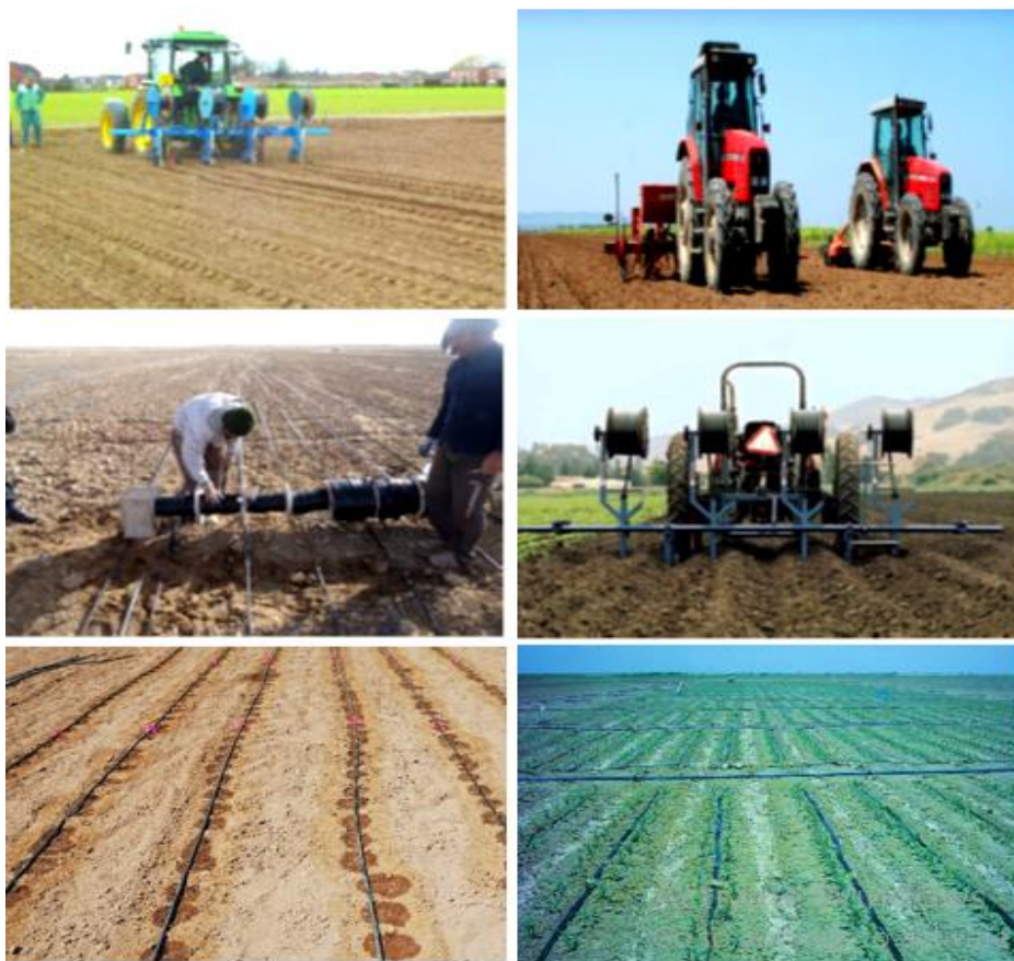
شکل ۵- مراحل مختلف آماده‌سازی زمین، پهن کردن نوارهای آبیاری (تیپ) روی زمین و کاشت گندم Figure 5- Different stages of land preparation, spreading of irrigation strips (tape) on the land, and wheat planting