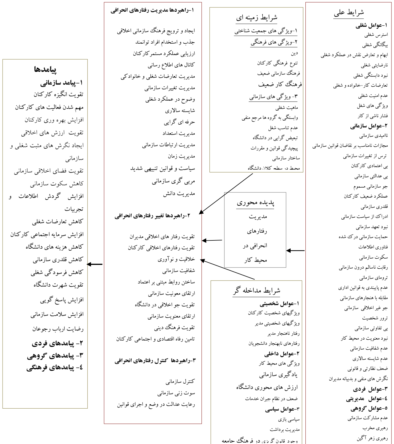
شکل (۴) مدل مفهومی مدیریت رفتارهای انحرافی در محیط کار