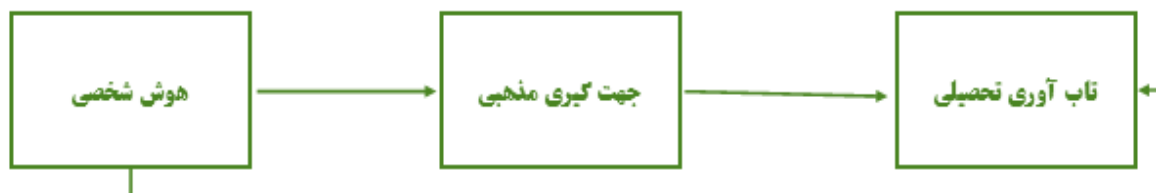
شکل ۱. الگوی مفهومی پژوهش

در سال‌های اخیر، علاقه به رابطه مذهب و معنویت با نتایج مراقبت‌های بهداشتی افزایش یافته است. معنویت به عنوان "جنبه انسانیت توصیف می‌شود به روشی که افراد به دنبال جستجو و بیان معنا و هدف و نحوه تجربه اتصال خود به زمان حال، به خود، با دیگران، به طبیعت و به معنای مهم یا مقدس" دارند اشاره دارد (پوچالسکی ۷ ، ۲۰۱۲)، به طور کلی، آلپورت و راس ۸ (۱۹۶۷)، جهت‌گیری مذهبی ۹ افراد را به دو دسته درونی و بیرونی طبقه‌بندی کرده، معتقد است: افرادی که دارای جهت‌گیری مذهبی درونی می‌باشند، مذهب در آن‌ها احساس راحتی، امنیت و سودمندی و