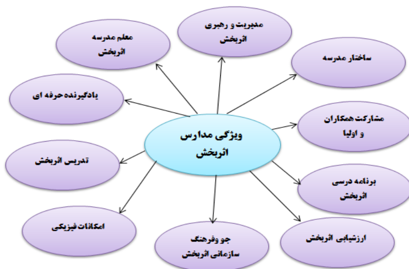
شکل شماره ۳: ویژگی‌های مدارس اثر بخش

مرحله هفتم: ارائه یافته‌ها: در گام نهایی فرآیند فراترکیب، یافته‌های حاصل از مراحل پیشین ارائه می‌گردد. در این مرحله یافته‌های حاصل از مراحل قبل در قالب یک مدل مفهومی ارائه می‌شود. در این پژوهش بر اساس نتایج تحلیل، ۱۰ مقوله کلیدی و ۶۴ کد شناسایی و آزمون کیفیت آن‌ها تأیید شد. مدل مفهومی ویژگی‌های مدارس اثر بخش در شکل ارائه گردیده است.